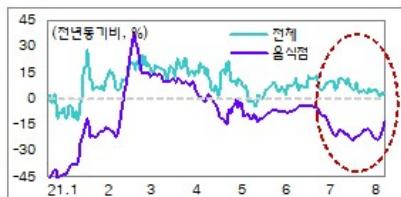
카드매출액 추이(7월 이동평균)